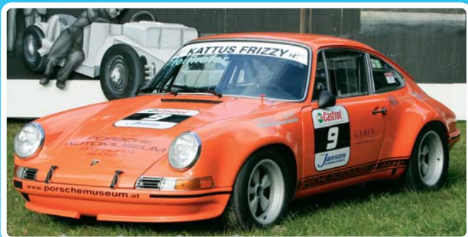
Porsche 911ST 2.5 – Tym rzadkim samochodem wyścigowym Christoph Pfeifhofer zdobył międzynarodową sławę