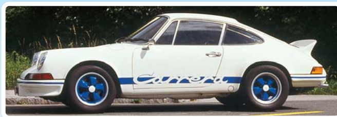
Porsche 911 Carrera RS 2,7 lekka sportowa konstrukcja

Zapraszamy państwa również do naszej kawiarni Cup-Cafe!