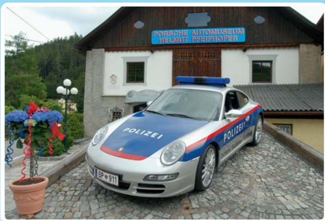
Jedyny w świecie oficjalny wóz policyjny Porsche, rok produkcji 2006