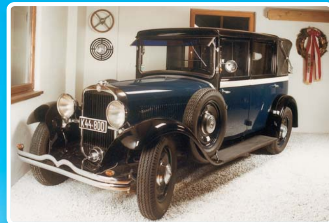
Steyr 30 typ 45 – taxi (1932)