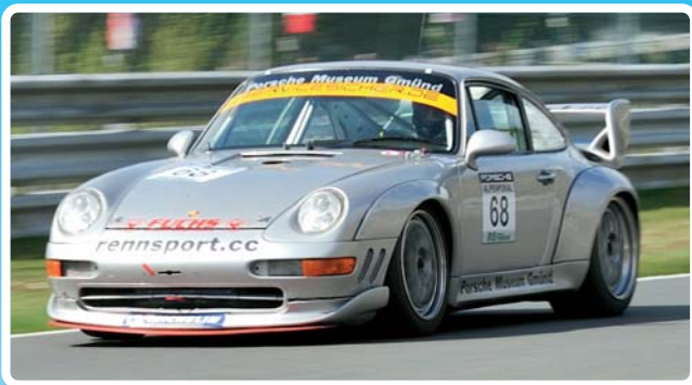
Porsche 993 RSR (dalekobieźny)