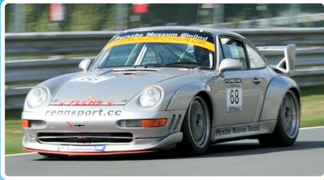
Porsche 993 RSR (endurance)