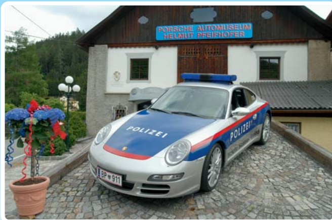
La seule voiture de POLICE Porsche officielle au monde, construite en 2006