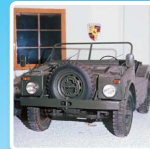
Porsche 597 Jagdwagen