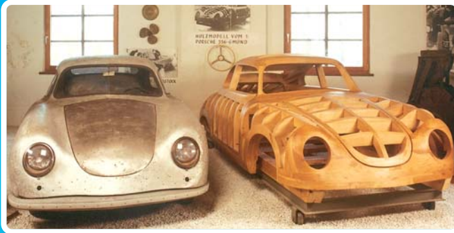
Porsche 356 de Gmünd en alu, maquette en bois