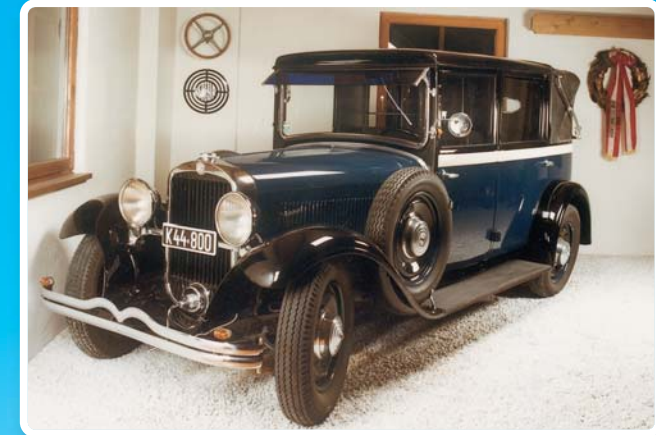
Steyr 30 Type 45 - taxi (1932)