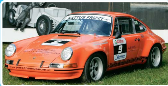
Porsche 911ST 2.5 – ce rare bolide fait le succès de Christoph Pfeifhofer à l'échelle internationale.