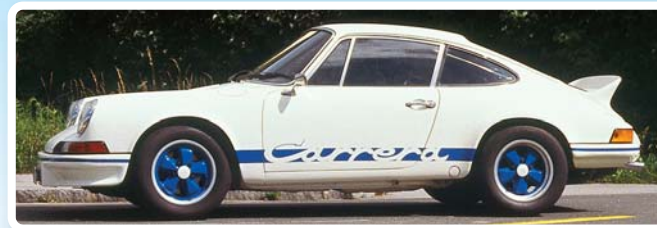
Porsche 911 Carrera RS 2,7 construction légère

Rendez-vous visite, et faites halte au « Cup-Café » !