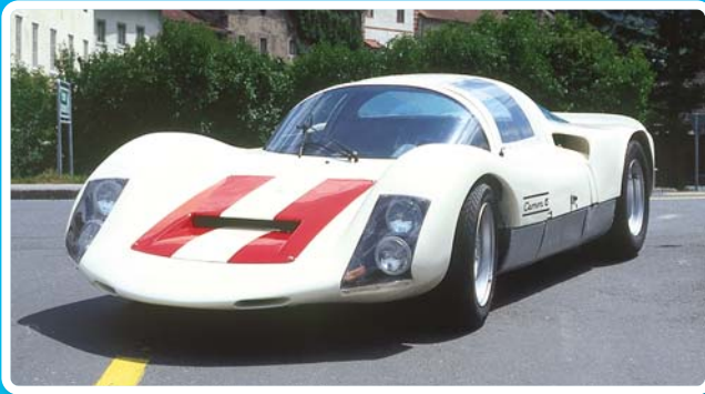
Porsche Carrera 906 – Le Mans

Ouvert toute l'année sans interruption Chauffage central en hiver