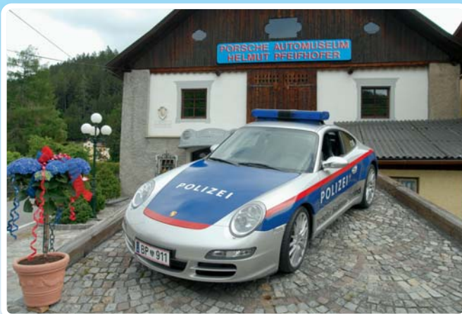
Weltweit der einzige offizielle POLIZEI-Porsche, Baujahr 2006