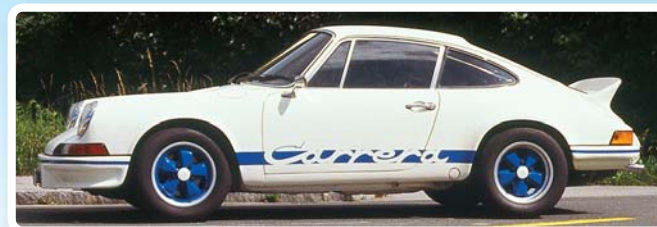
Porsche 911 Carrera RS 2,7 Leichtbau