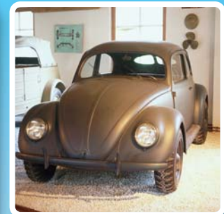
VW Typ 87 Kommandeurwagen