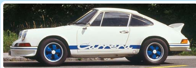
Porsche 911 Carrera RS 2,7 lichtgewicht