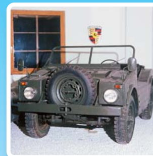
Porsche 597 jachtwagen