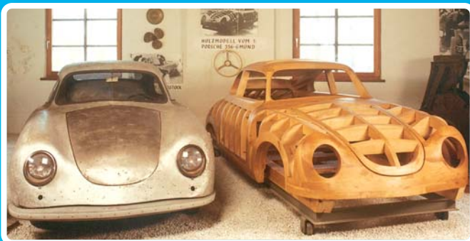
Gmünder Porsche 356 – aluminium, met houten model